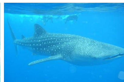
ดำน้ำลึก(ภาพด้านบนใช้เพื่อการอ้างอิงเท่านั้น)