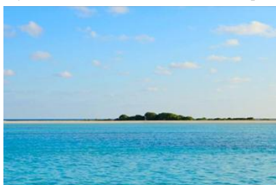
เที่ยวชมเกาะต่างๆ (ภาพด้านบนใช้เพื่อการอ้างอิงเท่านั้น)

กรุณาติดต่อเราหากท่านต้องการข้อมูลเพิ่มเติมเกี่ยวกับโปรแกรมท่องเที่ยวแต่ละรายการ